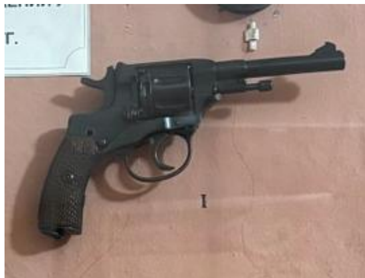
Револьвер «Наган» обр. 1895г.