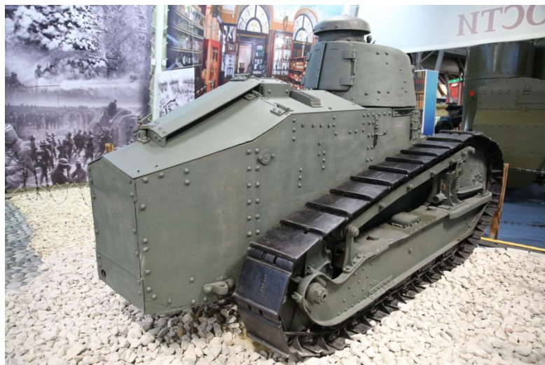
Французский танк «Рено FT-17»