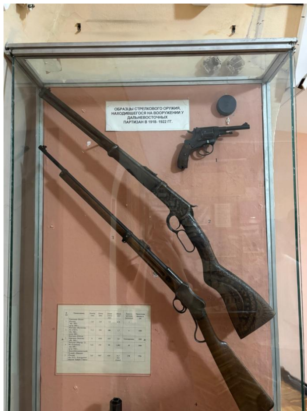
Винтовка «Винчестер-44» (США) обр. 1866 г. пр-во 1884 г.