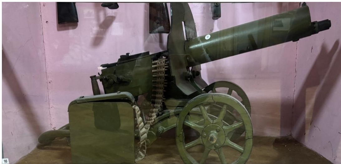
7,62 мм станковый пулемёт системы «Максим» образца 1910г. (СССР)