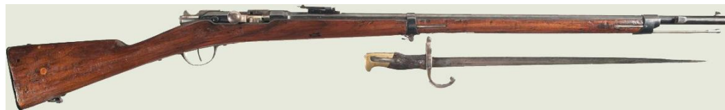
Французская винтовка «Гра»