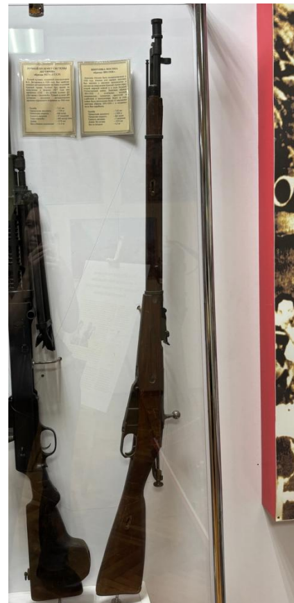
Винтовка Мосина образца 1891/1930 г.