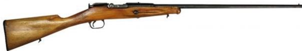
Винтовка Бердана №2