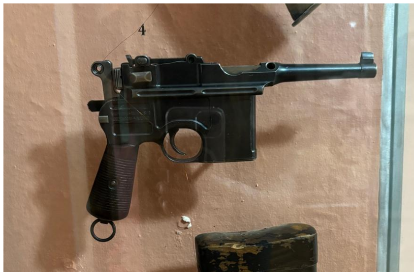
Пистолет «Маузер - К - 96» (Германия) обр 1896 г. пр-во 1920 г. «Боло»(большевистский)