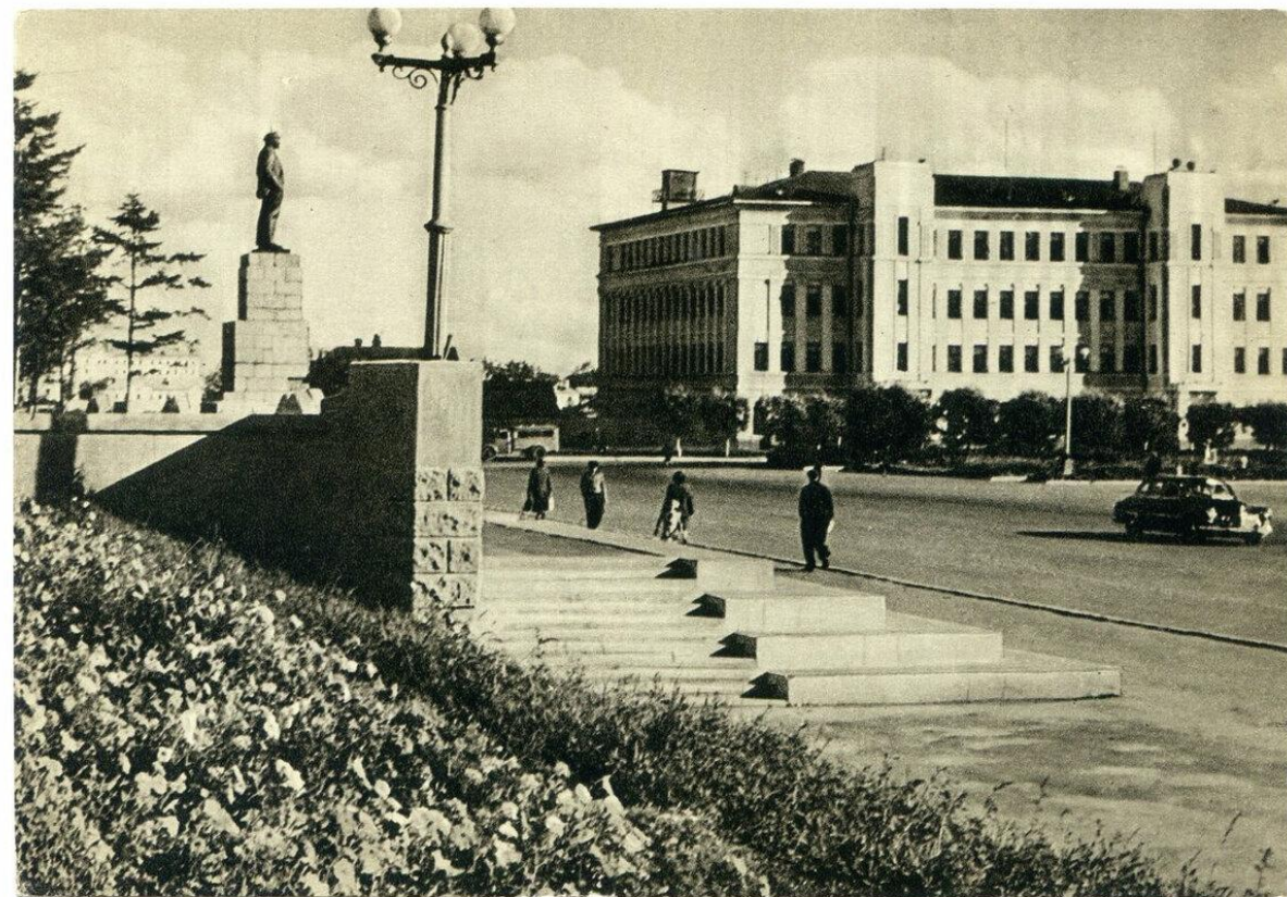
г.Хабаровск площадь им. Ленина 1955 г.