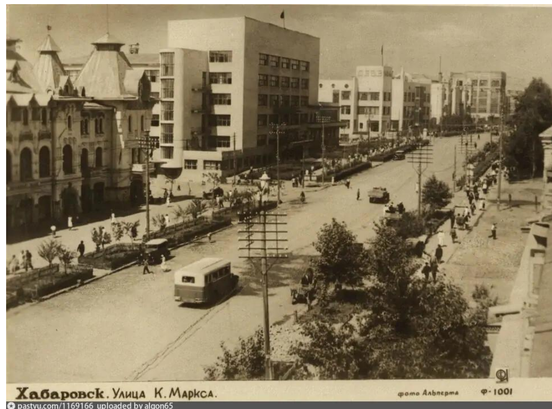
г.Хабаровск улица К. Маркса 1985 г.