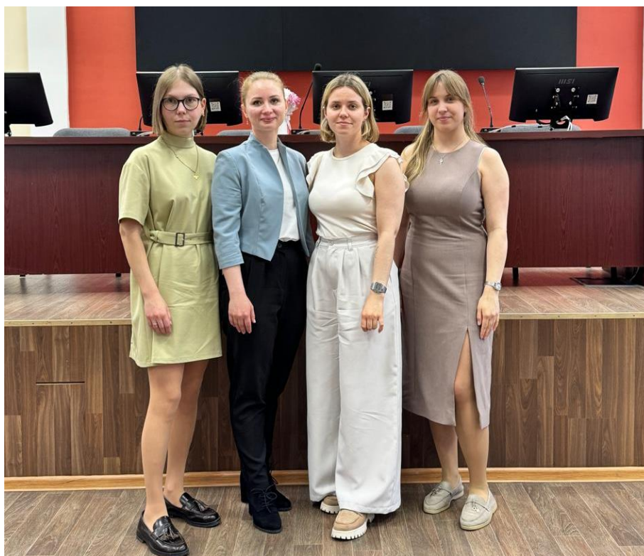
Кафедра педиатрии, неонатологии и перинатологии с курсом неотложной медицины