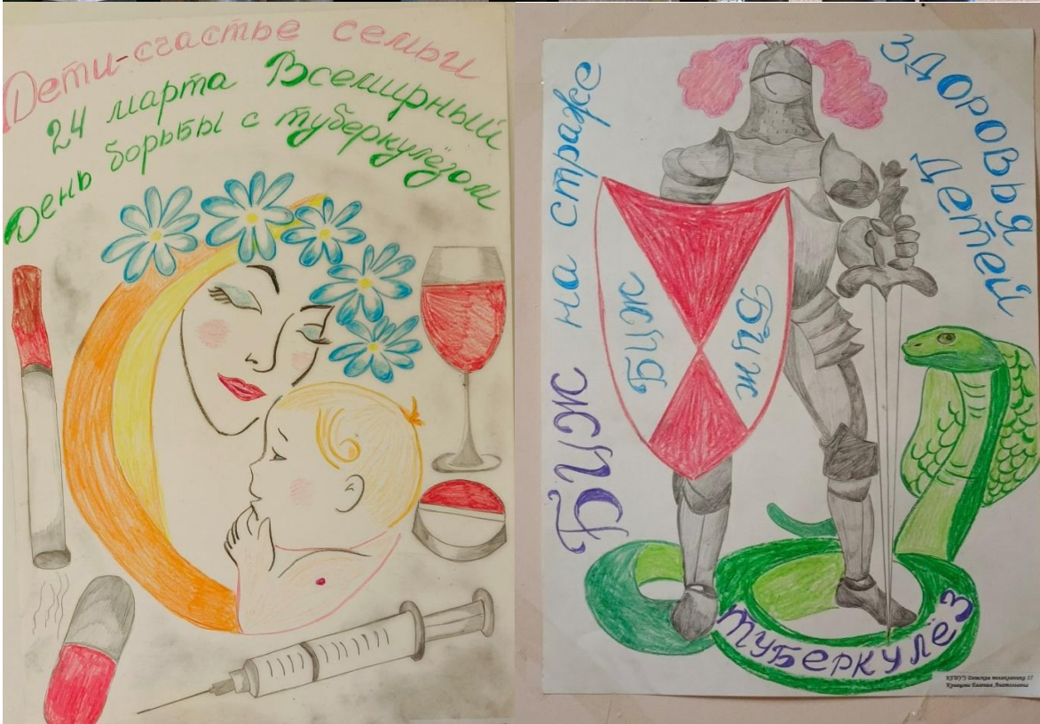
Информация подготовлена кафедрой пропедевтики внутренних болезней с курсом фтизиатрии