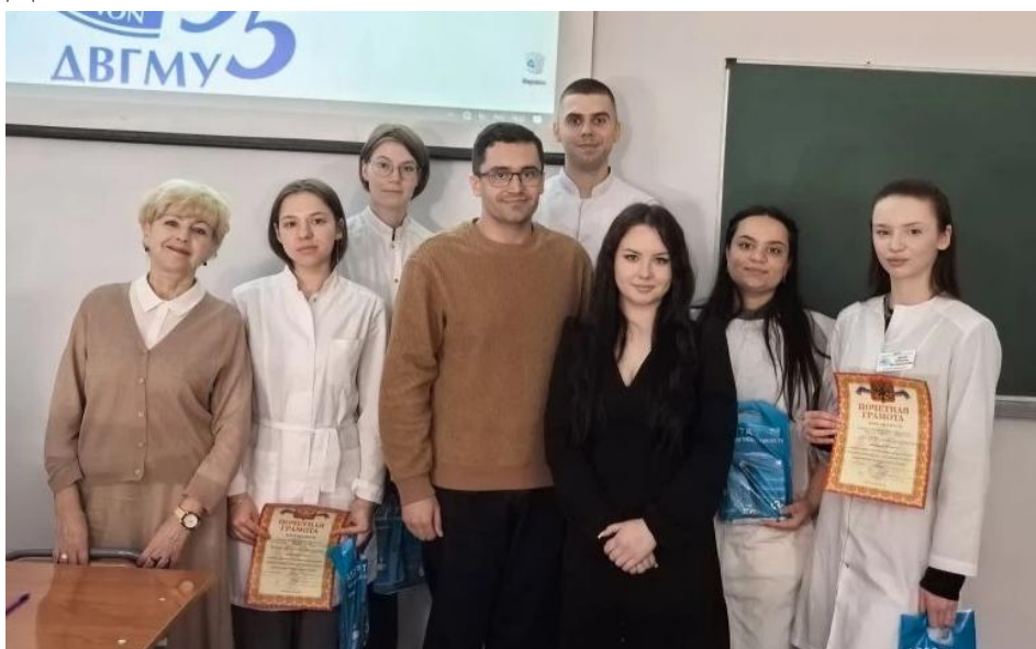
Награждение победителей от партнеров конференции

Всем участникам выданы грамоты и памятные подарки. Дополнительно призеры конференции были награждены подарками - курсом обучения в учебном центре компании «Альдента». Доклады участников будут оформлены в виде тезисных сообщений для публикации в сборнике X ДММФ.